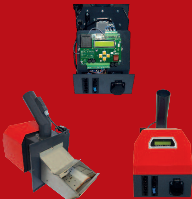
ATMOS A 25