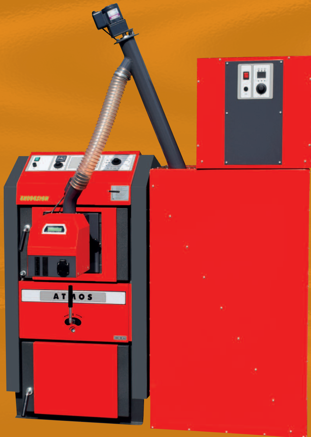
Kotel s nádrží na pelety a pneumatickou dopravou